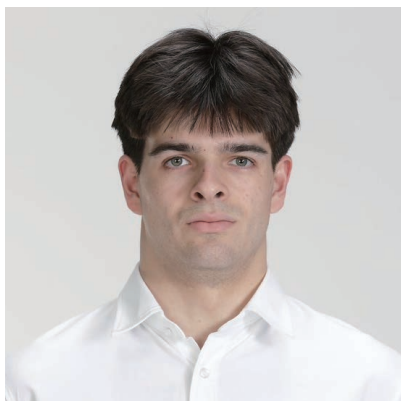
ザック・オサリバン